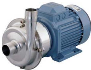
Pompe centrifuge Estampinox EFI