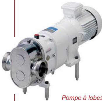
Pompe à lobes TLS

Le principal composant de l'équipement est un système de membranes hydrophobes qui laisse passer seulement les petites molécules gazeuses grâce à sa taille définie de petits pores. Seuls les gaz à faible poids moléculaire peuvent passer à travers la barrière, préservant ainsi les propriétés structurales du vin après la régulation de la concentration de gaz, en évitant la perte de composants aromatiques. Le vin circule côté extérieur des fibres creuses de la membrane, alors que côté intérieur un vide ou du CO 2 comme gaz de balayage est utilisé pour l'extraction de gaz. Pour l'incorporation, le CO 2 circule avec une surpression de 0,2 - 0,5 bar par rapport à la pression du vin et est, dans ce cas, directement dissous dans le vin, si besoin jusqu'à saturation. Le circuit d'eau pour l'extraction d'alcool circule côté intérieur de la membrane. Ainsi, du fait de la différence de concentration, l'alcool du vin passe dans l'eau à travers de la membrane. Cette opération est moins efficace que la gestion des gaz à cause du taux de perméabilité plus bas de l'alcool.